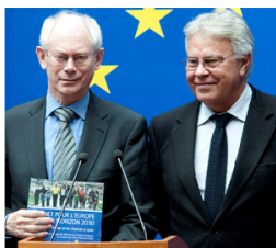
M. Herman van Rompuy et M. Felipe González, président du groupe de réflexion sur l'avenir de l'Europe.

Le 8 mai 2010 M. Felipe González, président du groupe de réflexion sur l'avenir de l'Europe, a remis à Monsieur Herman Van Rompuy, président du Conseil européen, le rapport de ce groupe intitulé « Projet pour l'Europe à l'horizon 2030 - Les défis à relever et les chances à saisir ».