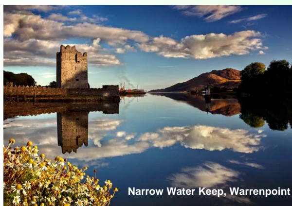
Narrow Water Keep, Warrenpoint